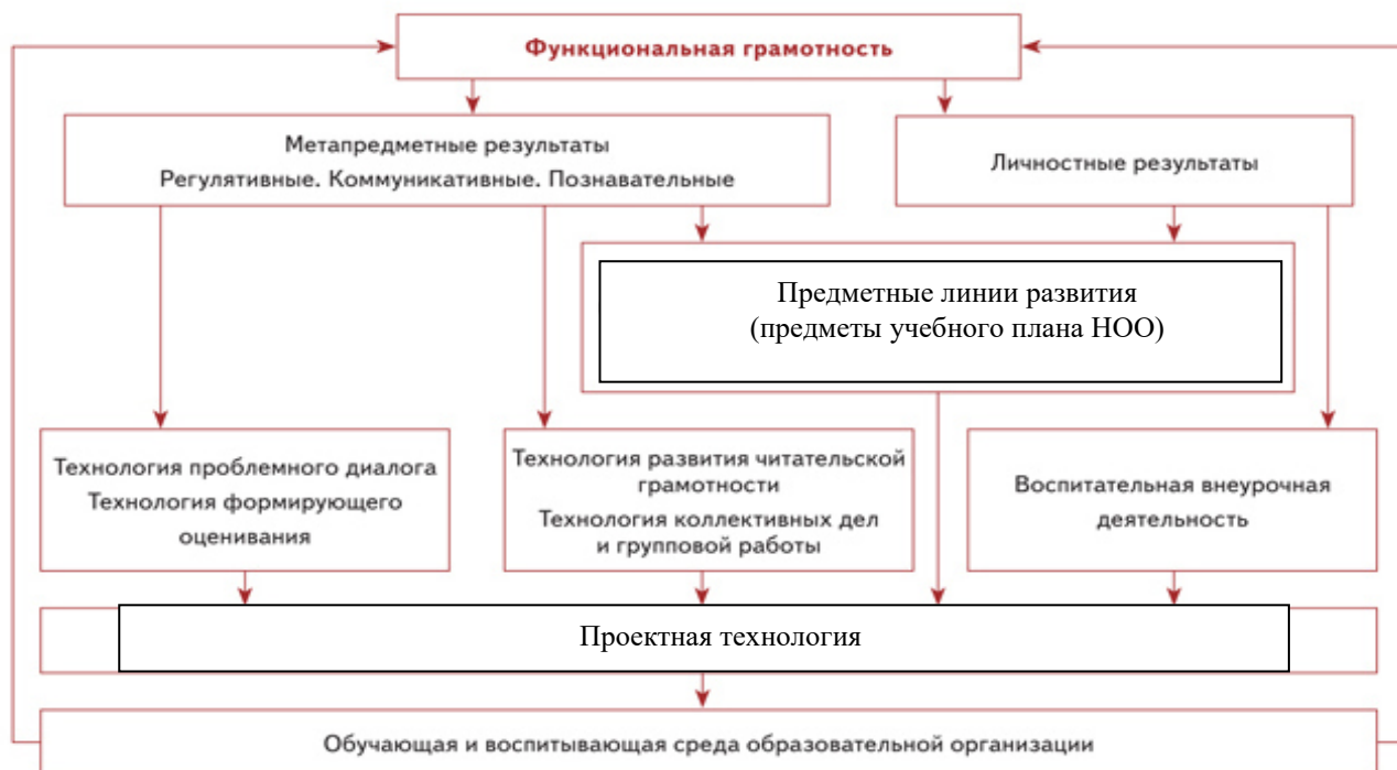
Схема «Система работы по обеспечению личностных и метапредметных результатов школьников»

Реализация цели развития младших школьников как приоритетной для первого этапа школьного образования возможна, если устанавливаются связь и взаимодействие между освоением предметного содержания обучения и достижениями обучающегося в области метапредметных результатов. Это взаимодействие проявляется в следующем: